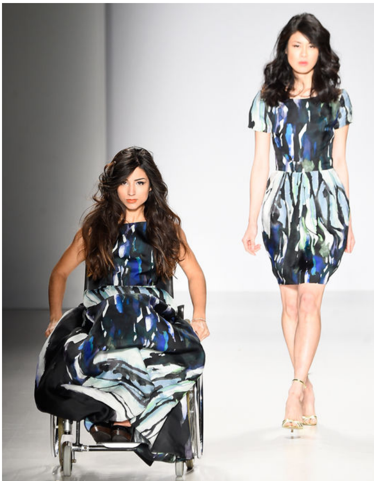
Le défilé du créateur Hendrik Vermeulen pour le collectif FTL Moda, à New York le 15 février 2015.

Quatre jours plus tard, le 16 février, le défilé FTL Moda ( http://www.ftlmoda.com ), un collectif de designers « made in Italy », est réalisé avec la Fondazione Vertical, une association italienne qui encourage la recherche pour soigner les lésions de la moelle épinière. L'agence britannique Models of Diversity ( http://www.modelsofdiversity.org/ ), qui comme son nom l'indique, lutte pour une plus grande diversité dans les médias et sur les podiums, participe également au show. Sur scène, des mannequins en chaise roulante côtoient les valides.